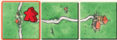
Rot erhält 3 Punkte.