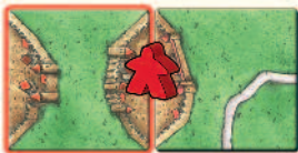
Rot erhält 4 Punkte.